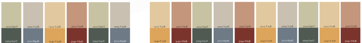
Bild ovan visar överst fasadfärg och under kulör för dörr och fönsterluckor på respektive radhus.